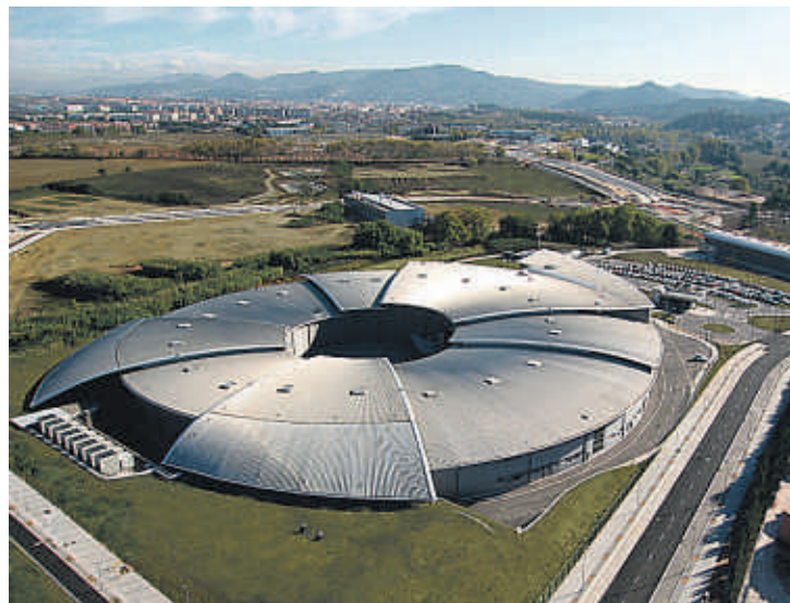
Una vista aérea del sincrotrón Alba, en Cerdanyola del Vallès

movimiento. Su perfil sinuoso dialoga armónicamente, a lo lejos, con el de Collserola. Y cobija, además de las instalaciones, una vía de servicio perimetral. El brazo de oficinas recibe abundante luz lateral y cenital (por una estructura