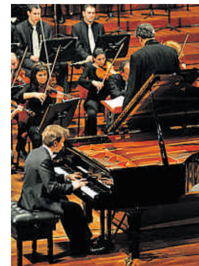
El pianista, durante su concierto

En la prueba final, la rusa Olga Kozlova, 23 años, abrió con el Concierto n.º 1 de Liszt, con técnica contradictoria, brazos pegados al cuerpo, su sonido,